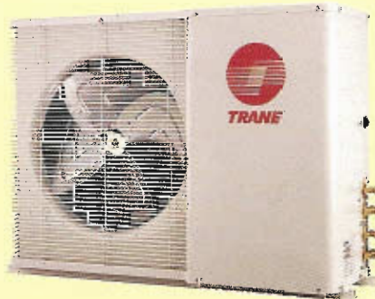
TTD518 - TTT536 18,000 - 36,000 BTUH

* La opción de un sistema MINI-SPLIT MULTIPLE de Trane, permite el acoplamiento de dos o tres unidades de mini-split interiores, con una sola unidad exterior.