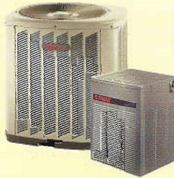
TTB012 - TTB024 2TTB0030 - 2TTB0060 12,000 - 60,000 BTUH

* La opción de un sistema MINI-SPLIT MULTIPLE de Trane, permite el acoplamiento de dos o tres unidades de mini-split interiores, con una sola unidad exterior.