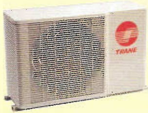
TTK512 - TTK060 12,000 - 60,000 BTUH

* La selección de aire de descarga HORIZONTAL o VERTICAL, permite la elección de la mejor unidad para espacios exteriores diversos.